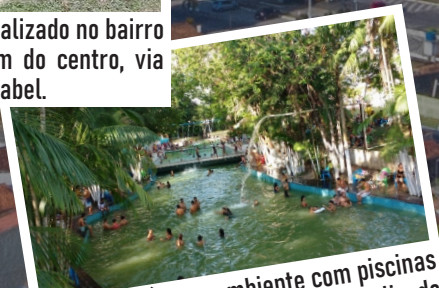
Parck das Águas, ambiente com piscinas naturais, chalés, restaurante. Localizado no bairro Bom Jesus.