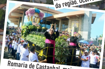
Romaria de Castanhal, maior evento religioso do município. Acontece no terceiro Domingo de Outubro.