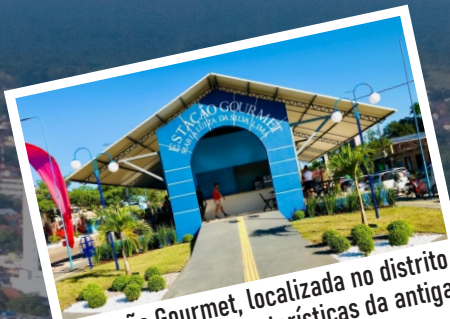
Estação Gourmet, localizada no distrito de Apeú. Trás características da antiga estação de trem.