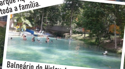
Balneário do Hirley, tem estrutura com piscina natural, restaurante e pesque e pague.