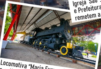
Locomotiva "Maria Fumaça", representa a extinta estrada de ferro de Bragança. Está exposta na Praça do Estrela.