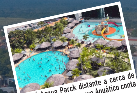
Guará Acqua Parck distante a cerca de 15km do centro. O Parque Aquático conta com diversão para toda a família.