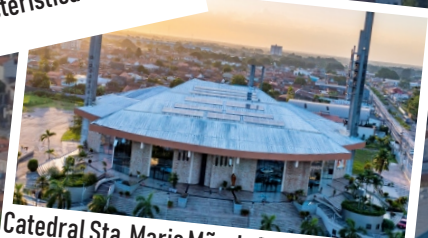
Catedral Sta. Maria Mãe de Deus, possui o 2º maior mosaico do Centro Aletti na América Latina e um dos maiores da América do Sul.