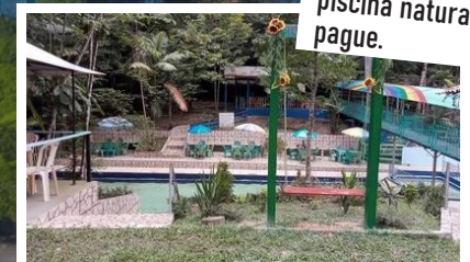
Balneário Odnumiar, localizado no bairro Cenóbio, distante a 8km do centro, via BR-316, sentido Santa Izabel.