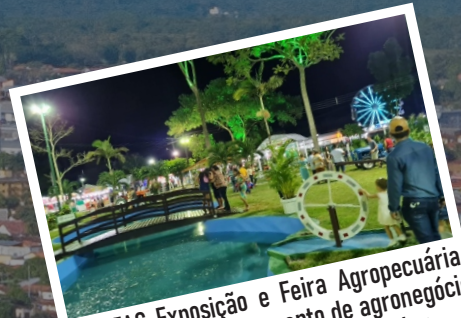
EXPOFAC-Exposição e Feira Agropecuária, maior e mais antigo evento de agronegócio da região. Ocorre no mês de Setembro.