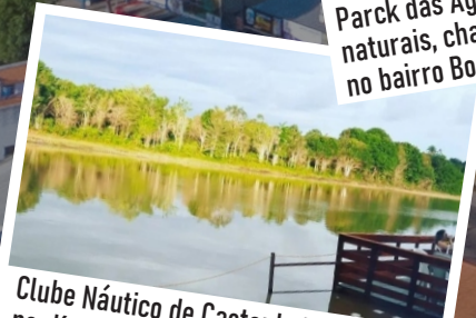
Clube Náutico de Castanhal, localizado no Km7 da Rodovia da Agrovila de Macapazinho.