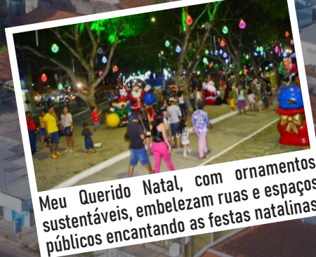
Meu Querido Natal, com ornamentos sustentáveis, embelezam ruas e espaços públicos encantando as festas natalinas.