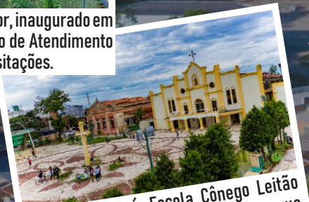
Igreja São José, Escola Cônego Leitão e Prefeitura, patrimônios históricos que remetem a origem do município.