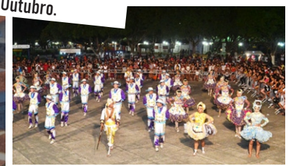
Festival Junino, marca a influência nordestina de Castanhal, com danças, comidas e músicas tipicamente junina.